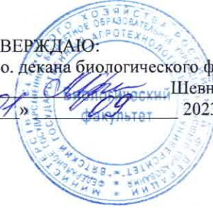
График проведения практик на Биологическом факультете в 2023/2024 учебном году обучающимися заочной формы обучения