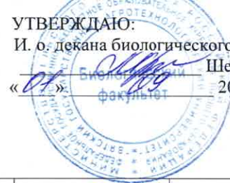
График проведения практик на Биологическом факультете в 2023/2024 учебном год обучающимися заочной формы обучения