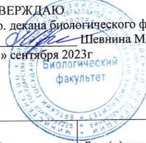
График проведения практик на Биологическом факультете в 2023/2024 учебном году обучающимися очной формы обучения