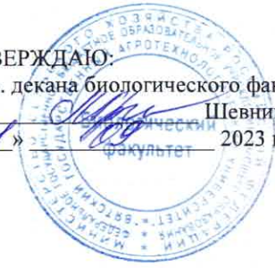
График проведения практик на Биологическом факультете в 2023/2024 учебном году обучающимися очно-заочной формы обучения