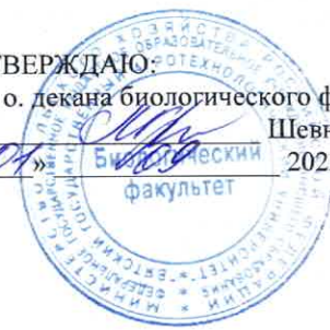
График проведения практик на Биологическом факультете в 2023/2024 учебном год обучающимися очно - заочной формы обучения